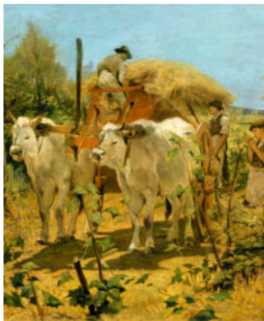
Giovanni Fattori, Raccolta del fieno in Maremma

Articolata in 10 sezioni tematiche , l'esposizione di Palazzo Martinengo racconta l'incredibile avventura di questo gruppo di artisti innovatori e progressisti che - desiderosi di prendere le distanze dall'istituzione accademica nella quale si erano formati sotto l'influenza di importanti maestri del Romanticismo come Hayez e Bezzuoli - giunsero in breve tempo a scrivere una delle pagine più poetiche della storia dell'arte non solo italiana, ma europea.