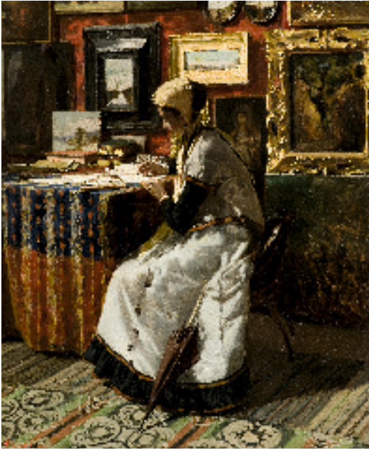
Telemaco Signorini, Non potendo aspettare