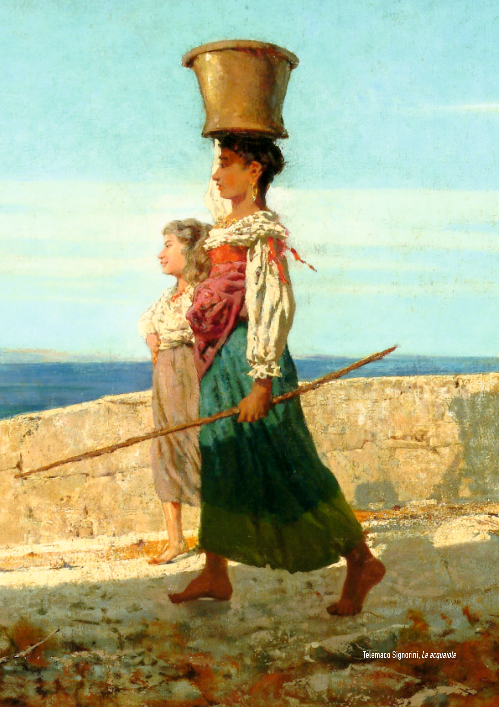
Telemaco Signorini, Le acquaiole