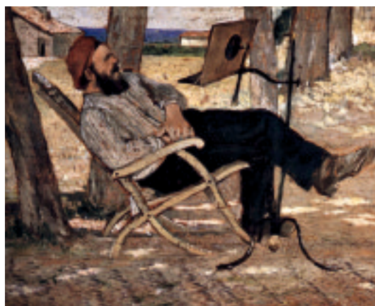
Giovanni Fattori, Diego Martelli a Castiglioncello