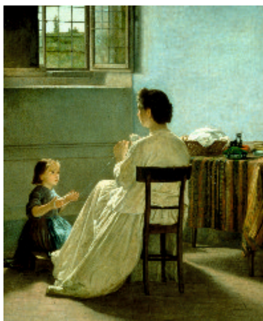
Silvestro Lega, L'educazione al lavoro