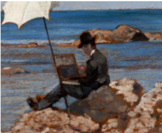
Giovanni Fattori, Lega che dipinge sugli scogli