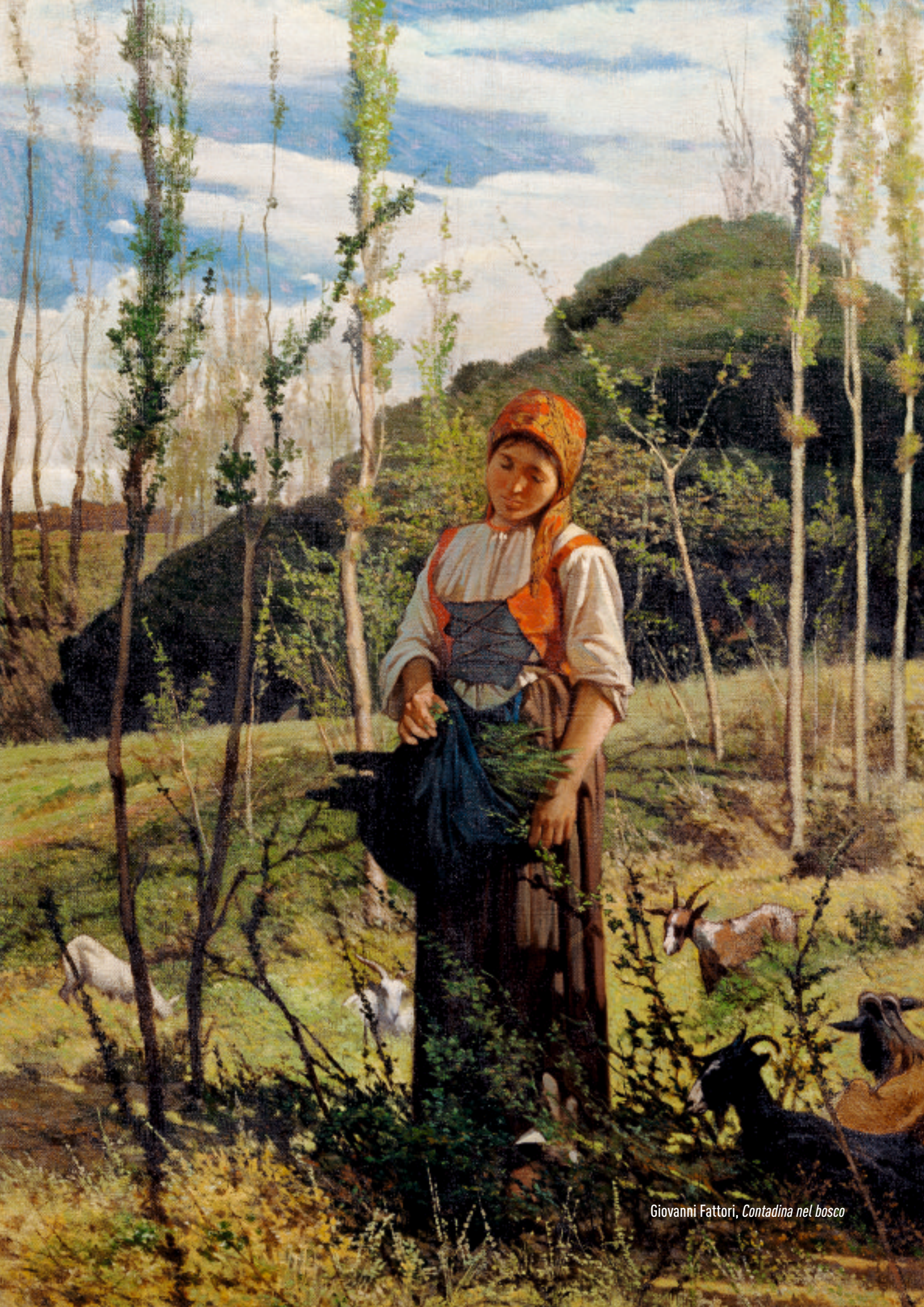
Giovanni Fattori, Contadina nel bosco