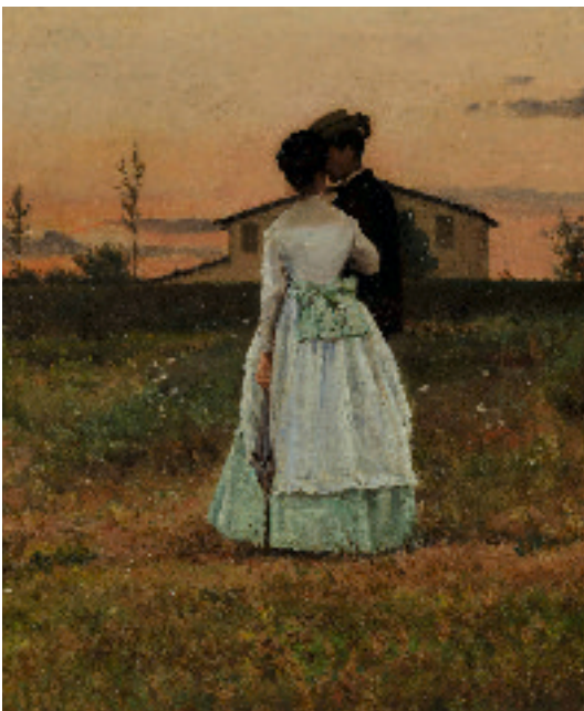
Silvestro Lega, I fidanzati

Ed è proprio per via dei valori universali che la sottendono che l'arte dei Macchiaioli risulta così moderna e attuale : straordinari capolavori esposti in mostra come le Cucitrici di camicie rosse di Borrani, la Raccolta del fieno in maremma di Fattori e Pascoli a Castiglioncello di Signorini rimangono indelebilmente impressi nella memoria, affascinando per la sublime qualità pittorica, lirica e luministica. Lo sguardo intimo sulla realtà a loro contemporanea, la visione antieroica e profondamente umana che i Macchiaioli ebbero del Risorgimento - saranno visibili tele di Fattori e Signorini che immortalano i luoghi dove si svolse la celebre battaglia di Solferino e San Martino - hanno del resto incantato anche il mondo del Cinema, da Luchino Visconti a Martin Scorsese.